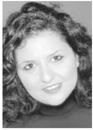
Της Κατερίνας Καρεκλίδου e-mail: kat.kareklidou@ gmail.com

θέση της άχρηστης μέχρι πρότινος τάρτας, μπορείτε πλέον να το νομιμοποιήσετε πληρώνοντας ένα απλό πρόστιμο. Αν για το σπίτι αυτό δεν είχατε βγάλει καθόλου άδεια, μη χολοσκάτε κι αυτό ταχτοποιείται πλέον.